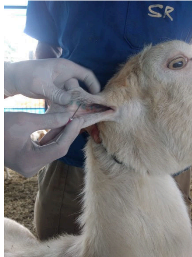
Punção de gota de sangue na orelha

TRABALHAR COM UMA GOTA ESPESSA E DE BOM VOLUME